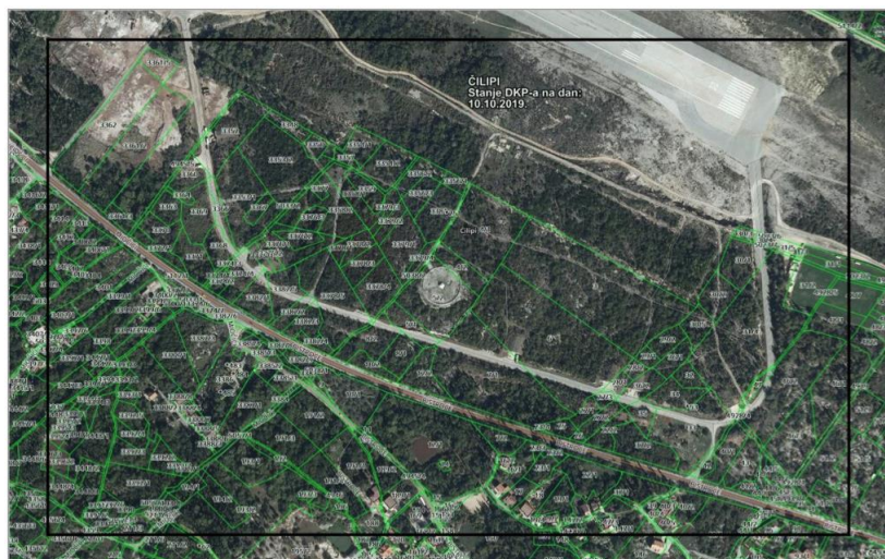
Slika 03. – Obuhvat predmetne zone na ortophoto podlozi, preklopljene sa DKP-om

Izmjene prostornih planova izvesti će se na temelju master plana koji je izrađen sukladno prikupljenim i usvojenim iskazanim interesima od strane Općine Konavle. Izrađivač master plana je trgovačko društvo Trames d.o.o., RH – 20000 Dubrovnik Šipčine 2, OIB: 80480322314.