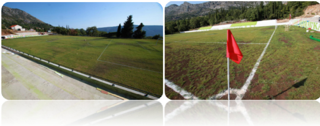
Slika 1. Nogometno igralište u Dubravci

Općina Konavle je Ministarstvu državne imovine 27. lipnja 2019. godine podnijela zahtjev za izdavanje isprave podobne za upis vlasništva za nogometno igralište u Grudi, ali za navedeno još nije dobila odgovor.