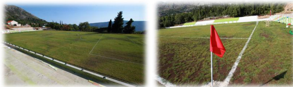
Slika 1. Nogometno igralište u Dubravci

Na području Općine Konavle nalazi se sedam nogometnih igrališta od kojih je samo jedno u (su)vlasništvu Općine Konavle; Nogometno igralište u Dubravci.