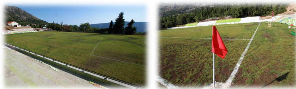
Slika 1. Nogometno igralište u Dubravci

Općina Konavle je Ministarstvu državne imovine 27. lipnja 2019. godine podnijela zahtjev za izdavanje isprave podobne za upis vlasništva za nogometno igralište u Grudi, ali za navedeno još nije dobila odgovor.